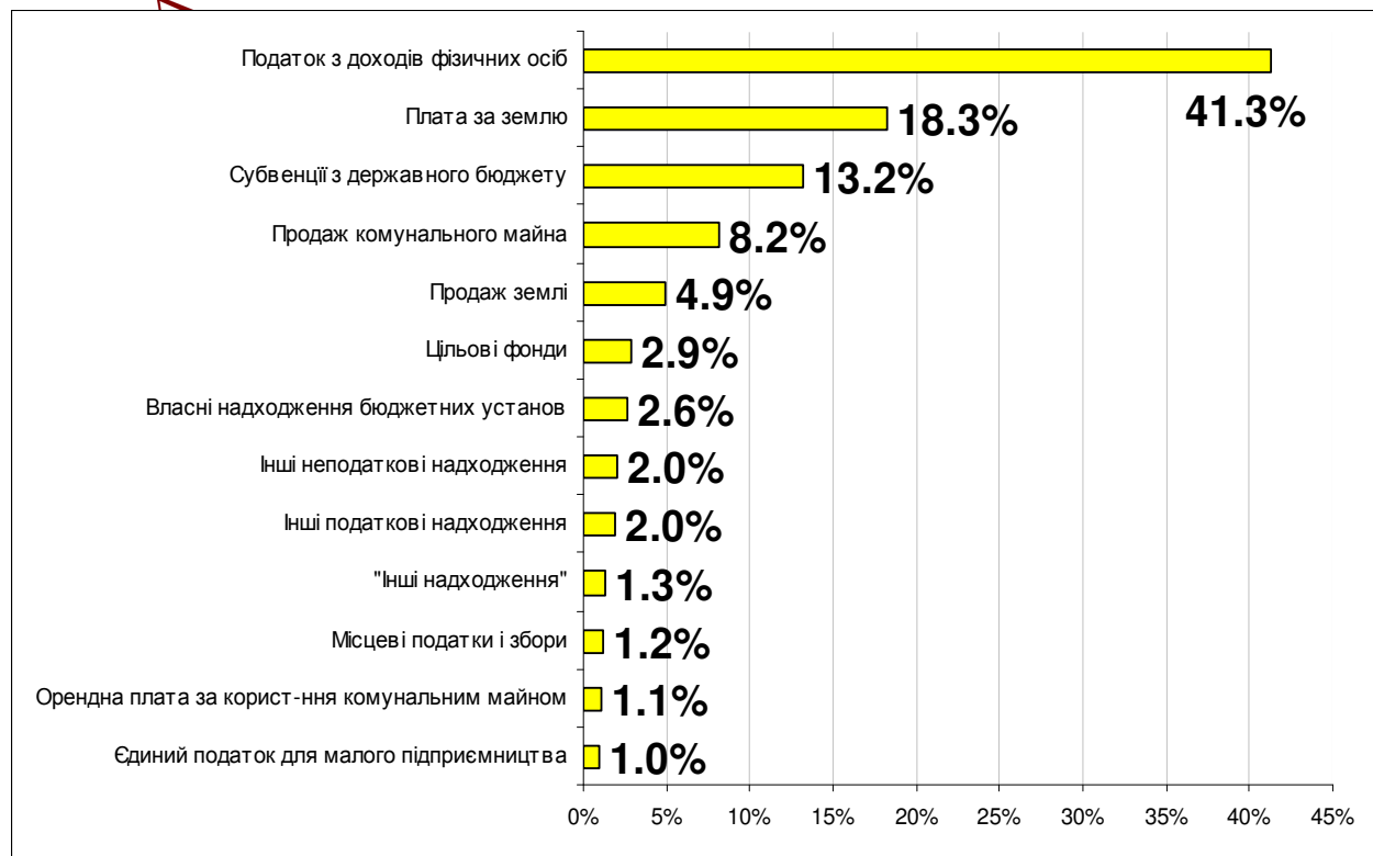
Рис. 2. Структура доходів бюджету м. Києва в 2011 році